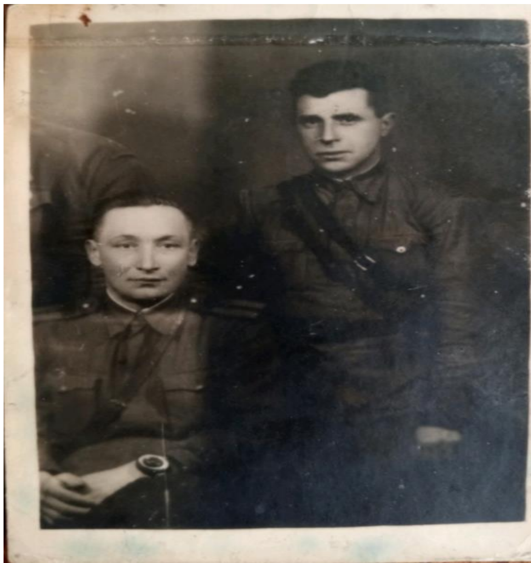
Рожден в 1950г.